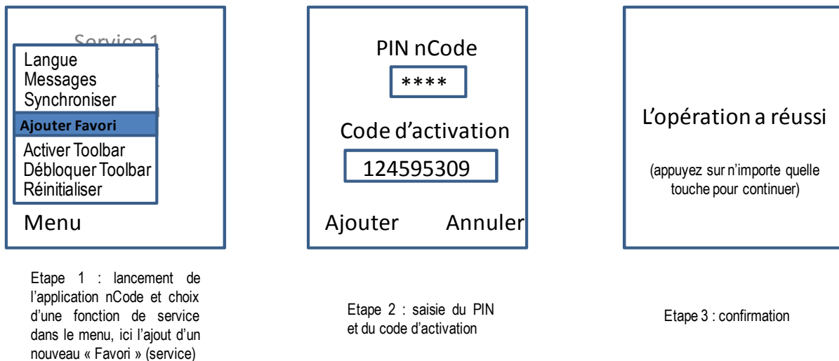
Fig 2 : Exemple de mise en œuvre d'une fonction de service, ici l'ajout d'un nouveau service (« Favori »)

Pour mettre en œuvre les « fonctions de service », l'utilisateur doit lancer l'exécution de l'application et sélectionner la fonction souhaitée dans un menu. Selon la fonction, il doit ensuite saisir son code PIN et/ou des informations propres au contexte. Selon le support où nCode est installé, l'utilisateur peut devoir autoriser l'ouverture d'une connexion par nCode à un serveur distant 4 . nCode indique ensuite le résultat de l'opération effectuée, réussite ou échec.