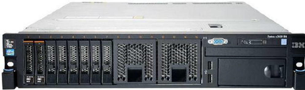
Figure 3 - Serveur IBM x3650 Series M4

Le produit a été livré par le développeur sur un serveur physique IBM x3650 Series M4 au format rack, identique à celui illustré sur la figure suivante :