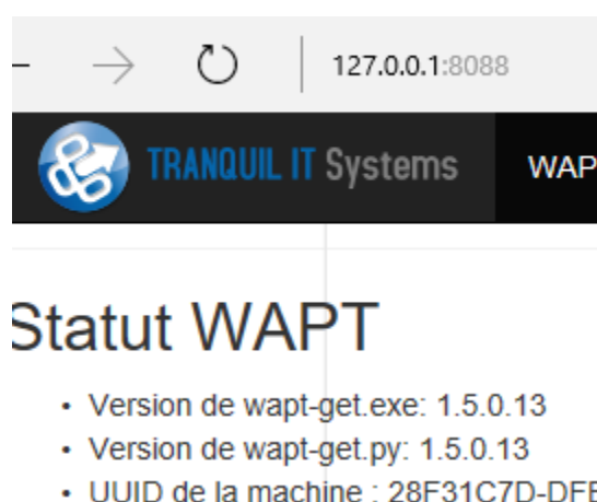
Figure 2 : Version de WAPT évaluée

Après installation de WAPT sur la machine d'administration, l'accès à l'URL http://127.0.0.1:8088 fournit différentes informations. Il est possible, par exemple, de retrouver le statut de WAPT, avec les versions des exécutables et scripts utilisés.