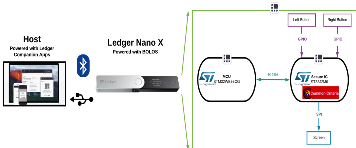
Figure 1 - Architecture Produit.

La figure ci-dessous explicite l'architecture du produit.